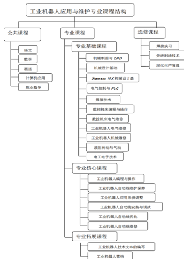
图2：工业机器人方向课程结构图

工业机器人方向的课程结构。由“公共课程+专业课程+选修课程”组成，其中专业课程又分为“专业基础课程+专业核心课程+专业拓展课程”，对应课程如图2所示，其中专业基础课程和专业核心课程主要由企业技师（工程师）进行教学，部分课程由学校专业教师经培训后教学，并制定相应的合格标准进行考核。